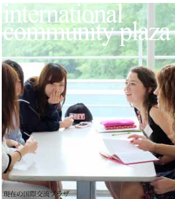
現在の国際交流プラザ

これらの施設は、現在八王子キャンパスでも多くの学生が活用しています。井の頭キャンパスではより多くの学生が活用できるよう、施設の充実を図ります。