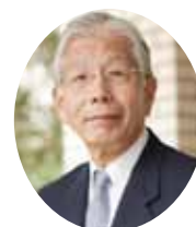
学長 跡見 裕

「八王子キャンパスの移転により、4 つの学部の垣根がより低くなり、相互の、教育面を含めた交流が密になるでしょう。総合政策学部の学生が保健学部で地域の健康づくり政策を考えることや、外国語学部の学生が医学部の学生とともに、国際観光医療のあり方を勉強することも考えられます。医学・保健学部の学生が総合政策学部で医療経済を学び、あるいは外国語学部で語学の実力をつけることができます。緑豊かな環境の中で、学生諸君が成長してゆく姿を見るのが楽しみです」