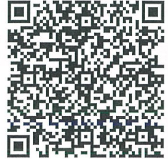
【事前登録用QRコード】