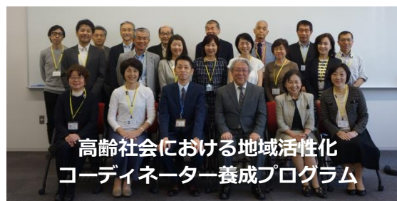
高齢社会における地域活性化 コーディネーター養成プログラム

4月4日(水)、平成30年度 高齢社会における地域活性化コーディネーター養成プログラム(履修証明プログラム)の開講式が執り行われました。