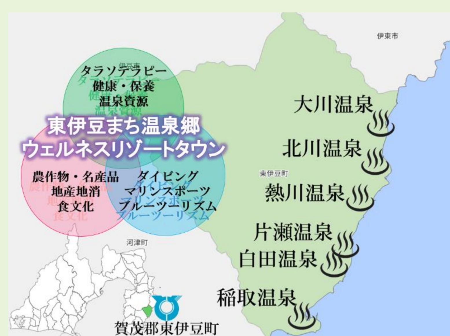
図2 東伊豆町における全体像