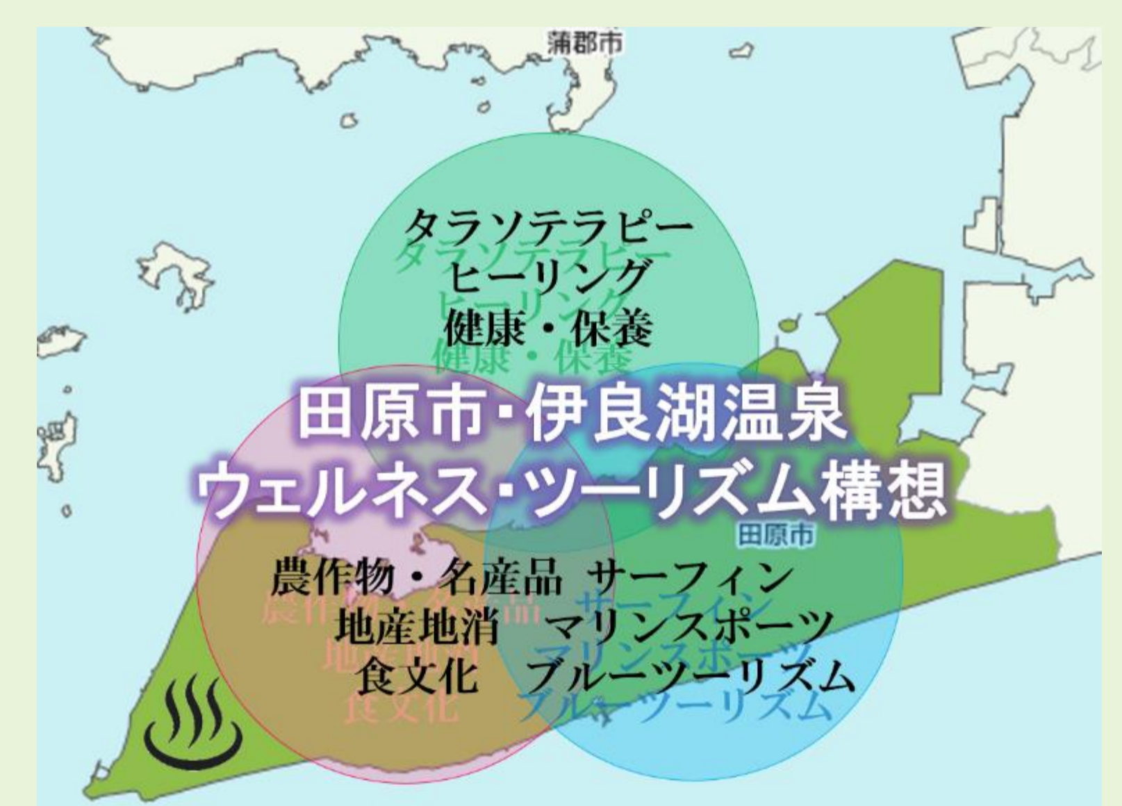
図3 田原市における全体像