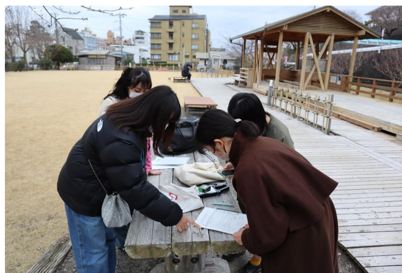
写真3 ウェルネス資源調査(足湯)