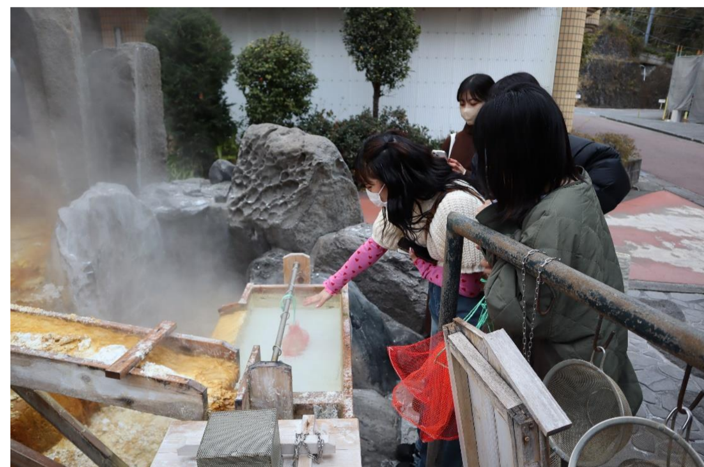
写真2 ウェルネス資源調査(源泉)

荒川らによると、ウェルネスツーリズムとはヘルスケアアプローチであり、旅を通じて健康を基盤としたライフスタイルを統合的にデザインしていくための有効な縦断の一つとしている。しかし今までのウェルネスツーリズムやヘルスツーリズムは主に温泉活用を主体したもの(スパツーリズム)が多い 1) 。我々の取り組みも日本の観光資源である温泉の活用と効果の検証は十分に考慮に入れる。今回、温泉をはじめとするウェルネス資源について現地調査によって確認した(写真2~5)ので、温泉資源を基軸としたうえで、レクリエーション・スポーツ・マインドフルネス・リラクゼーション・文化活動など、その土地ならではのアクティビティの提供を企図した新たなウェルネスツーリズムプログラムの創出を目指していきたい。