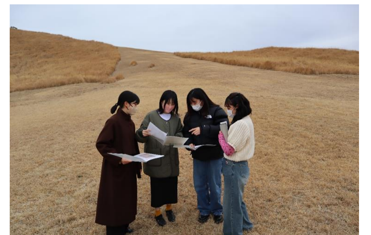
写真5 ウェルネス資源調査(トレッキングコース等)