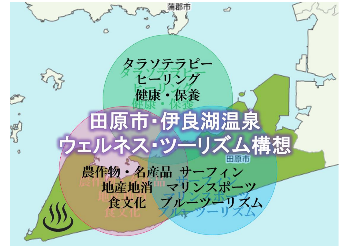
図3 田原市の地域概要