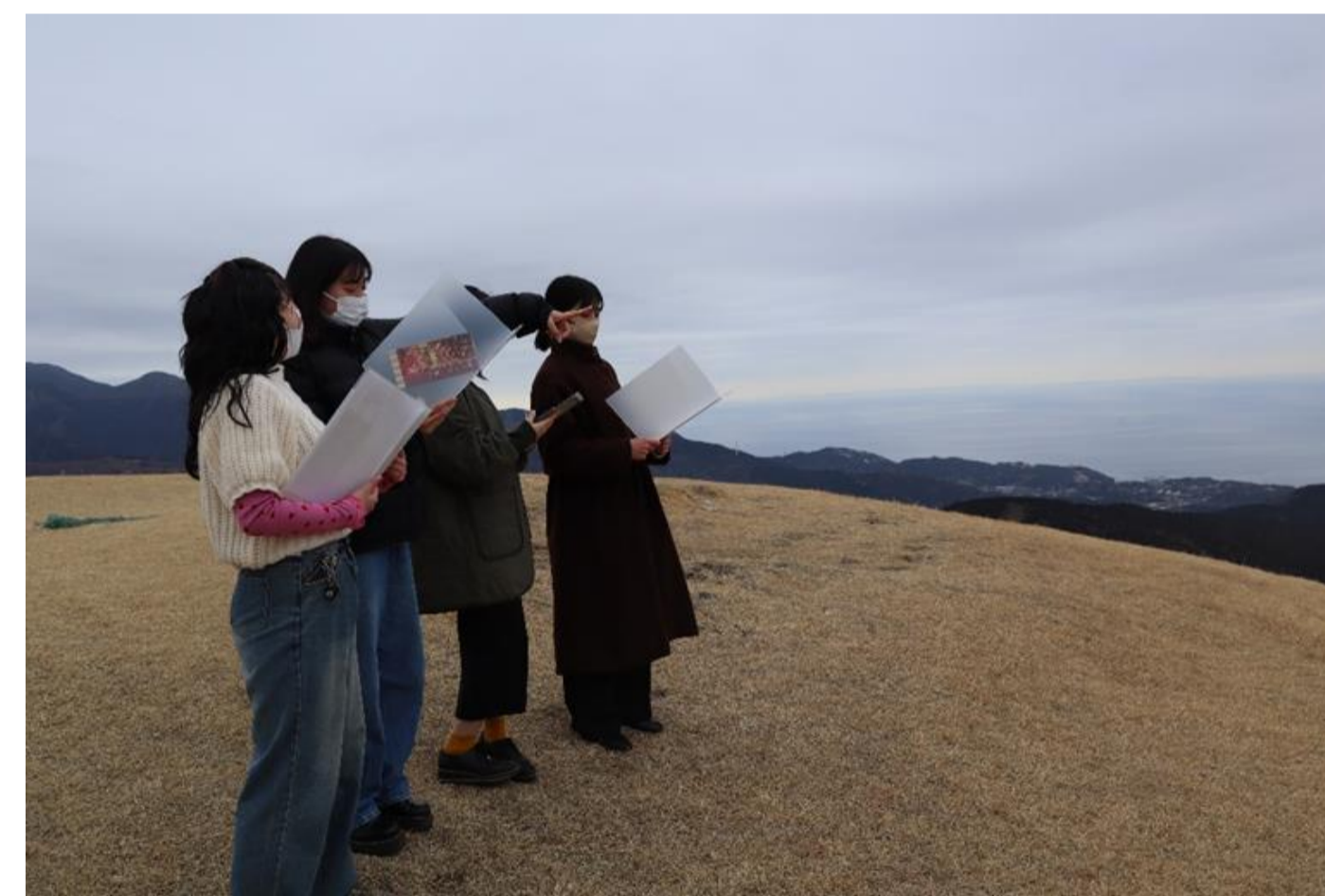
写真4 ウェルネス資源調査(ジオパーク等の自然景観)