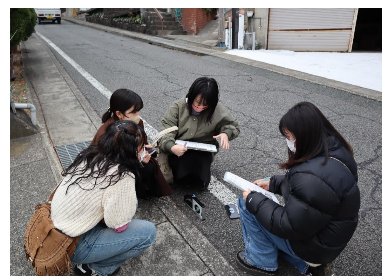
写真6 バリアフリー調査(温泉街)

障がいや介護の必要性の有無、年齢、嗜好性などの多様性を考慮し、より多くの人を楽しめ、更に健康増進や幸福感を享受できる観光プログラムを構築することとした。また、観光地および観光施設のバリアフリーとユニバーサルデザインの導入を目指して、まずはより汎用性のある評価手法の規格化から開始し、実際に現地調査を実施した(写真6~9)。