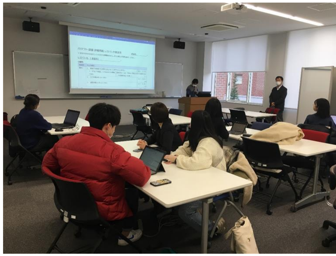
写真1 保健・観光学生の合同ゼミ