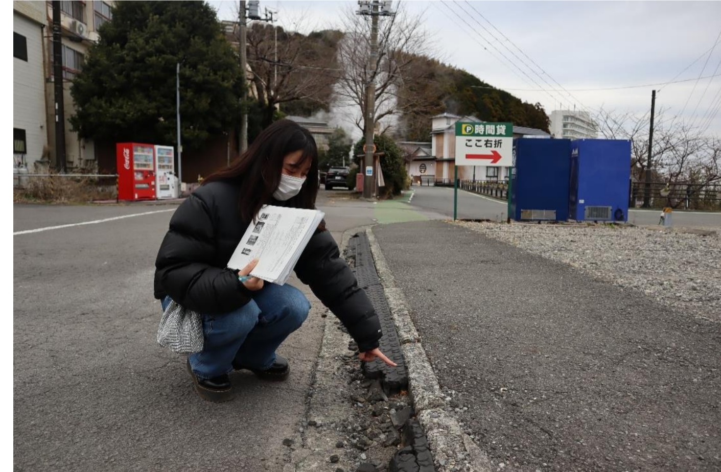
写真8 バリアフリー調査(課題抽出)