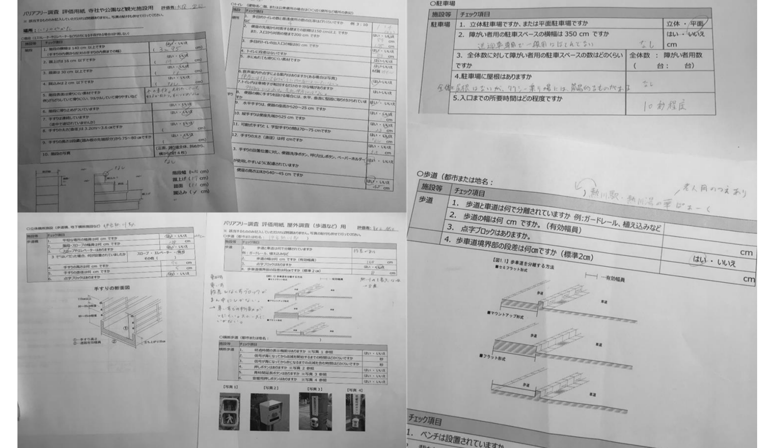
写真9 バリアフリー調査用紙・結果