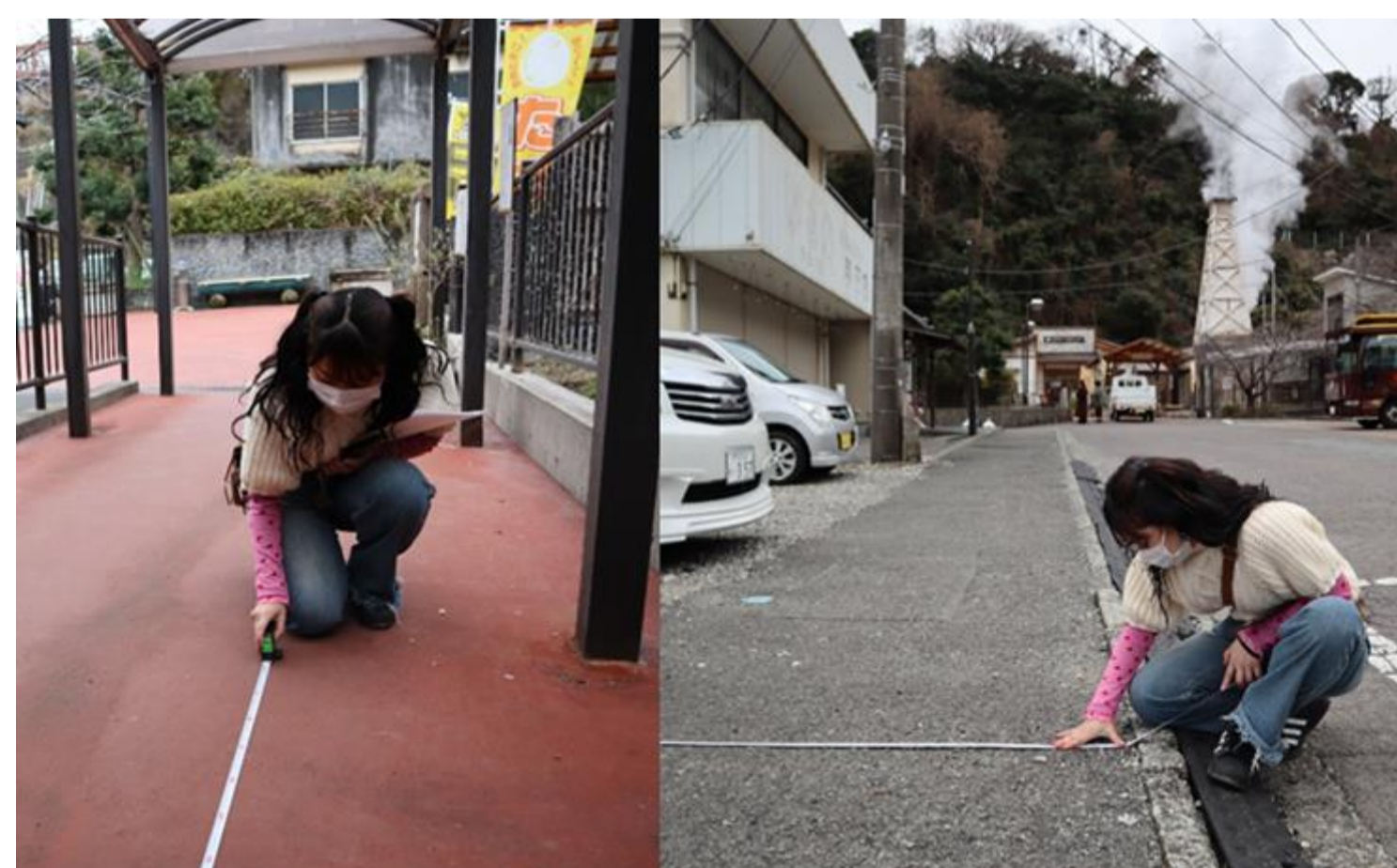
写真7 バリアフリー調査(駅前)