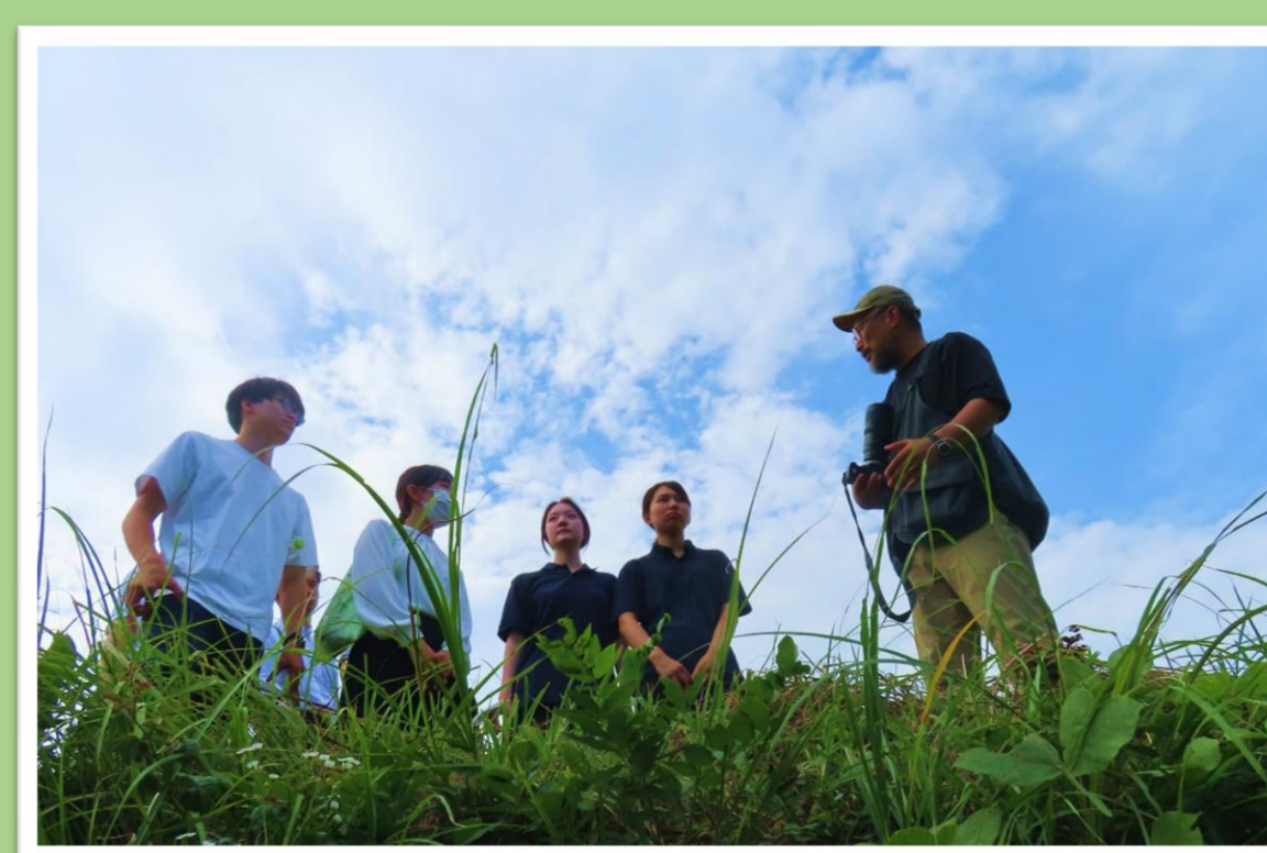
写真7 「かしま」の空気感に触れるフィールド学習

さらに、多職種に加え、他業種や当事者との関わりから、専門性を知識・技術の量に限らず、 尊厳を守り語り を引き出す関係構築や場づくりについて学んだ。これは、 医療職内の価値観に閉じないプロフェッショナリズム理解を促し、地域医療の実践に必要な敬意・自己省察・学び続ける姿勢 の形成につながる可能性を示す。