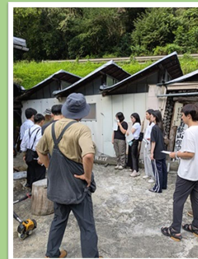
写真5 みろく沢炭鉱館主からのレクチャー

医療と「地域との関係性」を捉える中で、 参加学生が地域医療を「病気の治療」ではなく「生活を支える営み」として捉え直す記述が多くみられた 。参加学生にとって 地域医療は、治療の成否だけで評価されるものではなく、生活の継続や尊厳、幸福の実現へと目的が拡張された実践 として理解されていた。すなわち、地域医療の価値が「治すこと」から「暮らしを支えること」へと再編され、「地域の生活者の幸福への支援」へ視点が移行していた。さらに、生活を中心に据えた支援の実現には、医療機関内の提供行為にとどまらず、複数の専門性や多様な担い手が関与する枠組みが必要であるという理解も形成されていた。