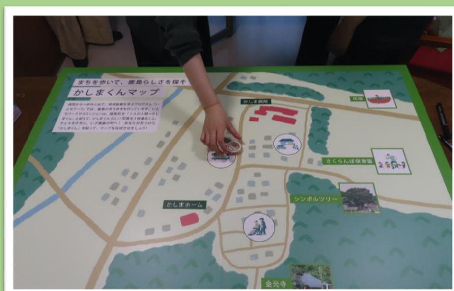
写真2 「かしま」らしさをマッピング