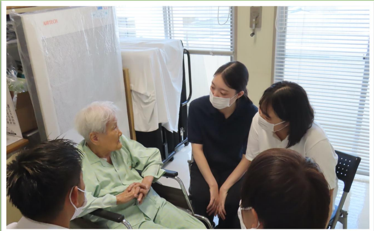
写真3 患者さんとのコミュニケーション

参加学生は、地域で生活する人々との交流の中で、 患者を「疾患をもつ対象」としてのみ見るのではなく、生活者として捉える視点を獲得していた 。たとえば、「自分ごととしての患者目線」の形成を示す自由記述として、「患者さん一人ひとりの、愛する地元・地域を知り、そのバックグラウンドも丸ごと含めて汲み取って、医療を提供することだと感じています。」という記載がみられた。ここには、 患者の生活世界に踏み込んで理解しようとする姿勢 が表れており、学びが単なる知識獲得にとどまらず、実践上の構えとして内在化していることがうかがえた。このような姿勢は、「人として向き合う姿勢」を基盤に、 患者の背景を情報として知る段階から、価値観・生活史・地域性を含む全体像として理解しようとする姿勢へとつながっていた 。さらに、上記の記述は続けて、「そのためは、いとちワークでの学びのように医療者が患者さんの地域を知ろうとすることが大切である」と述べ、 実体験をもって学びました 。」と述べており、「生活背景の理解の必要性」が実感を持って獲得されていた。すなわち、患者理解の焦点が疾患中心から生活背景へと移行し、地域医療の学びが対象者の生活を支えるという方向へ収斂していた。