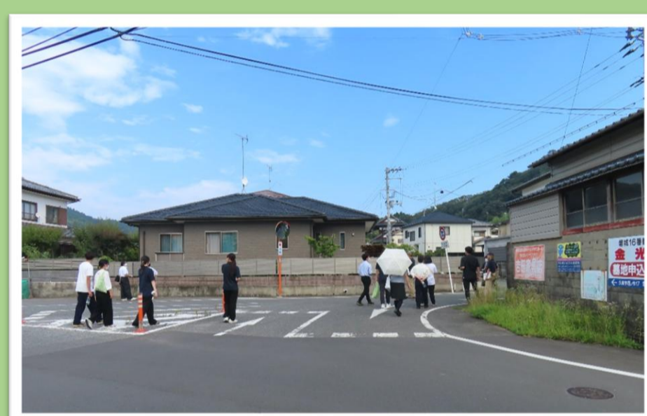
写真1 「かしま」らしさを探すまち歩き